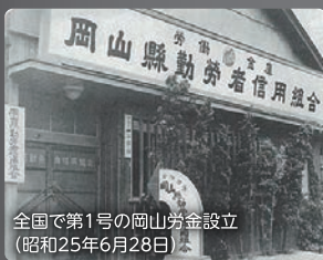
全国で第1号の岡山券金設立 (昭和25年6月28日)

ろうきんは、戦後の混乱した社会環境の中、はたらく仲間の生活を守るために設立されました。