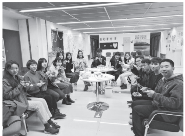
中国雲南師範大学で学生達と