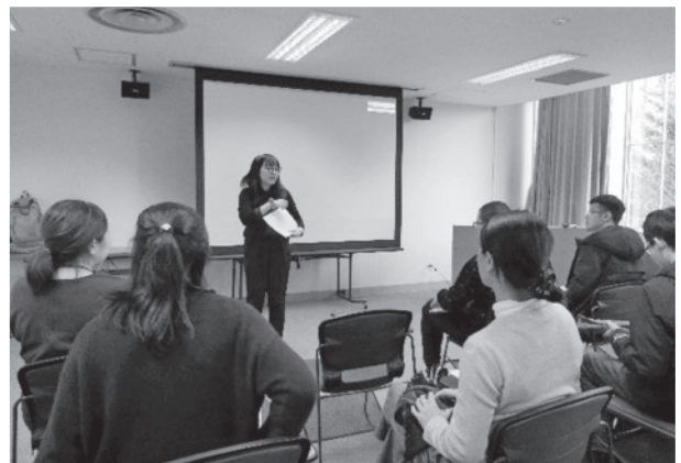
留学生に対する日本語授業

今、私は日本語教師として更なるステップアップのため、北海学園大学に戻ってきて、修士課程を履修しています。修士生として過ごしながらも、他大学の留学生と民間企業の技能実習生に日本語を教えているので「先生」と呼ばれています。「先生」と慕われることが何よりも喜びであり、この喜びが一生続くことを願っています。