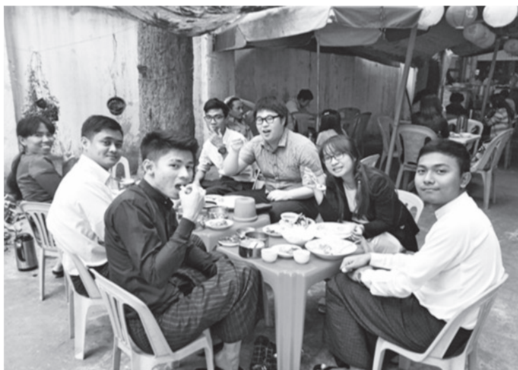
ミャンマーでの日本語学校職員との交流 (右から3人目が私です)