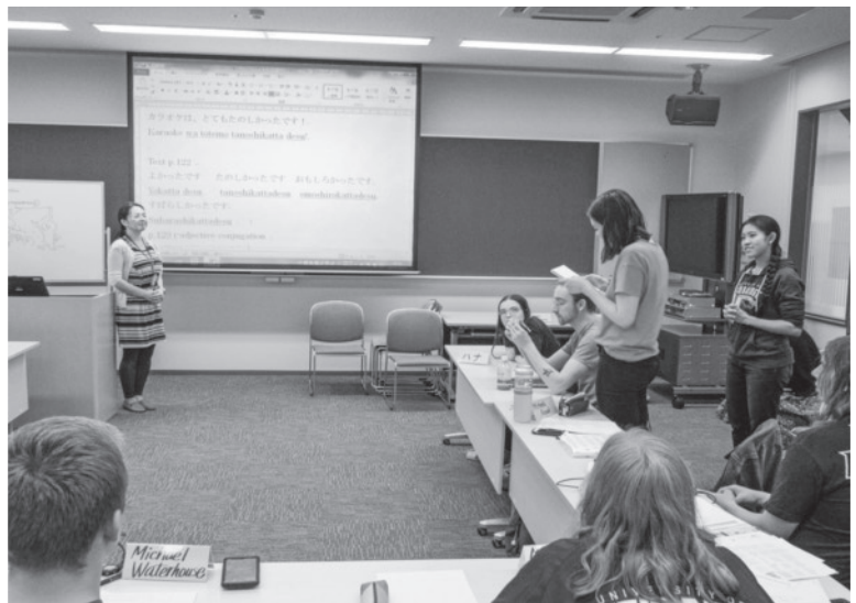
レスブリッジ大学学生への日本語授業風景

2019年現在は、北海道に来た外国人技能実習生へ日本語を教えています。今後は引き続き本学の研究生として研究を進め、春からは北海道大学の留学生センターにて多国籍の留学生へ日本語を教えながら、研究者・日本語教師としてキャリアを積んでいきたいと考えています。