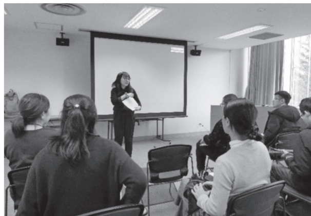
留学生に対する日本語授業

今、私は日本語教師として更なるステップアップのため、北海学園大学に戻ってきて、修士課程を履修しています。修士生として過ごしながらも、他大学の留学生と民間企業の技能実習生に日本語を教えているので「先生」と呼ばれています。「先生」と慕われることが何よりも喜びであり、この喜びが一生続くことを願っています。