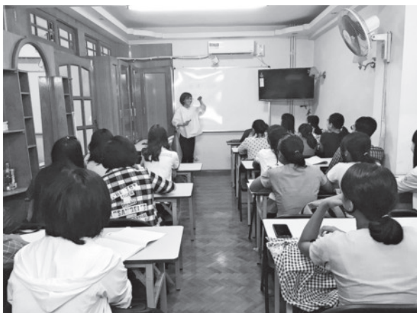
ミャンマーでの日本語授業

日本語教師養成課程の履修を考えているみなさん、日本語教師になれば、その先には素敵な夢が沢山あると、私は思います。ぜひ、履修してみてください。