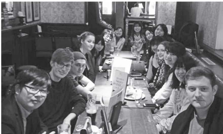
英国カーディフ大学で学生達と（右から3番目が私です。）

現在は、日本語教育とは関わらない仕事をしておりますが、いつか日本で社会人として働いた経験を活かし、語学だけではなく、日本について色々発信ができる日本語教師になることが目標です。日本語教育課程の授業は、経済学部の私でも面白いと感じる授業ばかりでしたので、人文学部以外の方でも、興味があれば是非受講されることをお薦め致します。